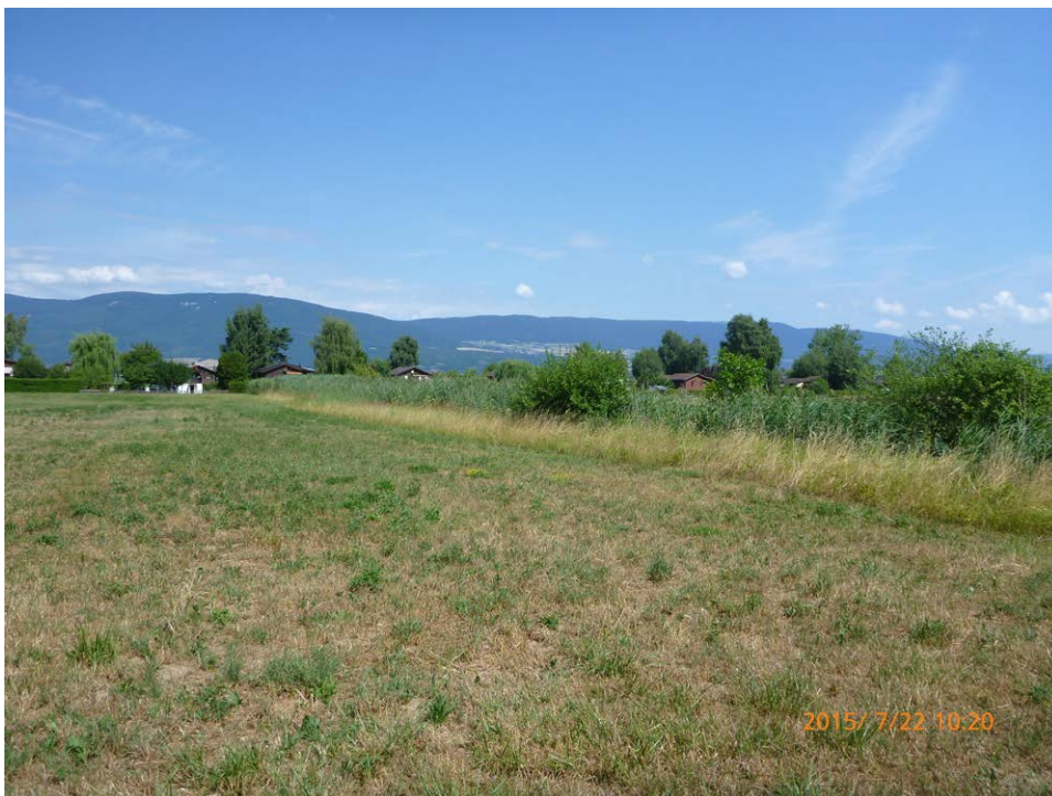
Photos de l'objet 22.07.2015